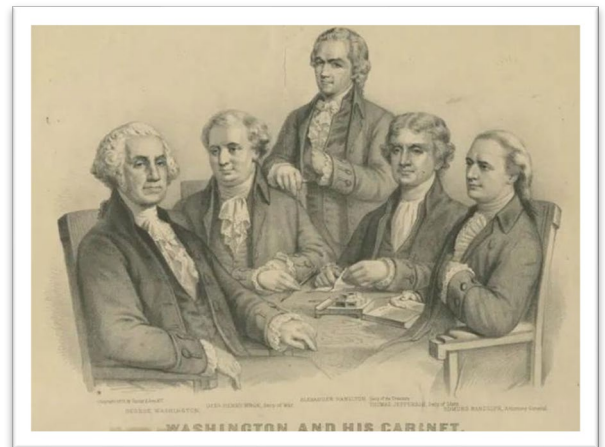
"Washington and his Cabinet" lithograph by Currier & Ives, held by Library of Congress Source: public domain

The committee report concluded that the principal causes of the military failure were delays in obtaining supplies, mismanagement and neglect by the Quartermaster and contractor Duer, and a lack of experienced and disciplined troops. On February 26, 1793, the report was formally presented to the House, and the investigative committee was