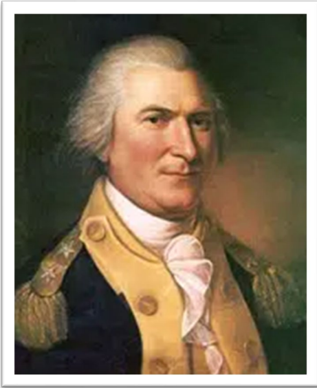
Retrato del general Arthur St. Clair, de Charles Wilson Peale, 1782.